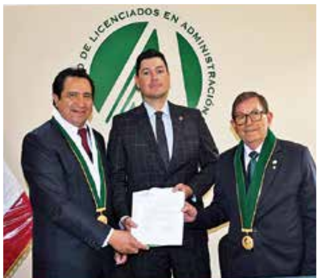
Convenio con Michigan School S.A.C