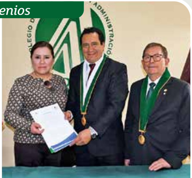
Convenio con Talento Center