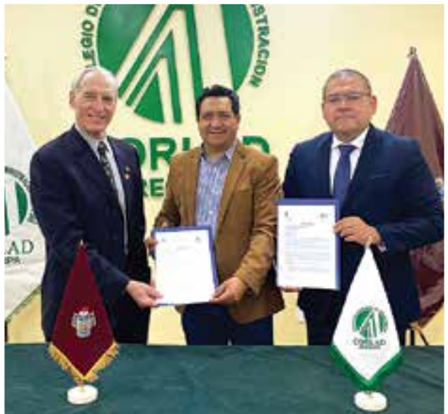
Convenio con Blackwell Global University