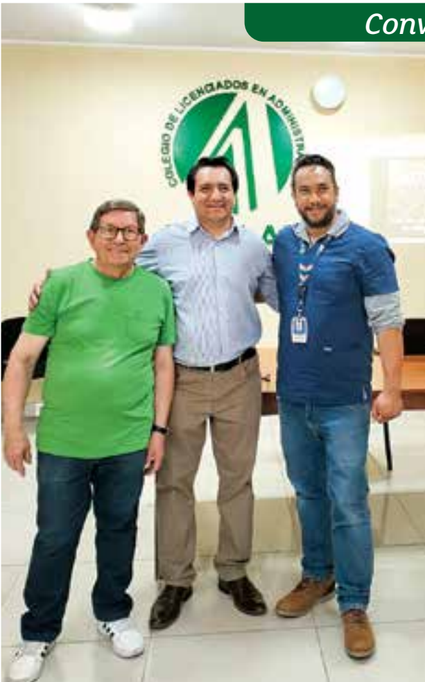
Convenio con Centro Óptico Guillén Tamayo