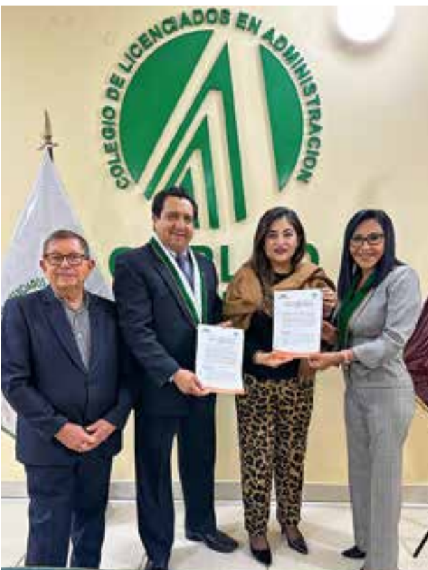
Convenio con Fisiomedical